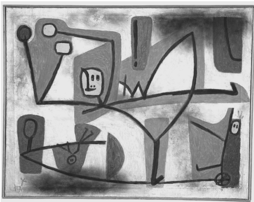
Übermut, Paul Klee, 1939